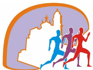
A.S.D. Amatori Terralba